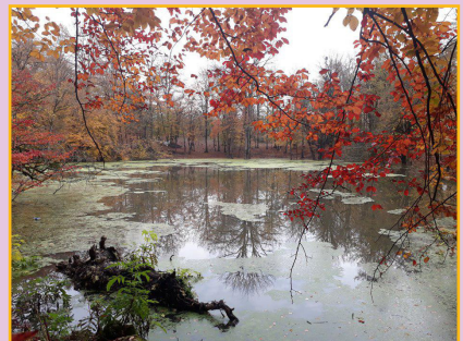
فاطمه نورمندچالشرتی (نفر دوم)