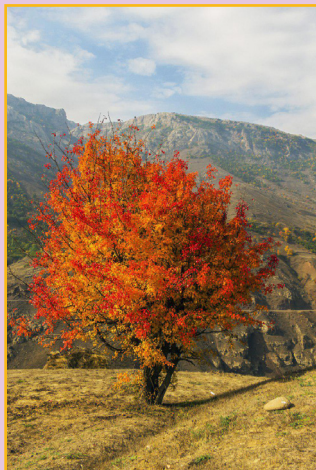
عارف منتقمی (انتخاب دانشگاهیان)